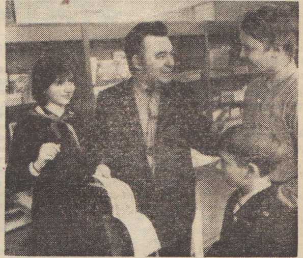
ЖУРНАЛИСТ МЕНЯЕТ ПРОФЕССИЮ